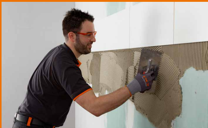
Die Leichtfüllstoffe machen das Aufziehen so geschmeidig und leicht wie noch nie.

Auch großformatige, schwere Fliesen können mühelos ohne nachrutschen an der Wand fixiert und entspannt bis ca. 15 Minuten nach dem Einlegen korrigiert werden. PCI Nanolight ist der universelle Star im PCI-Universum. Einer für alle Untergründe und alle keramischen Beläge.