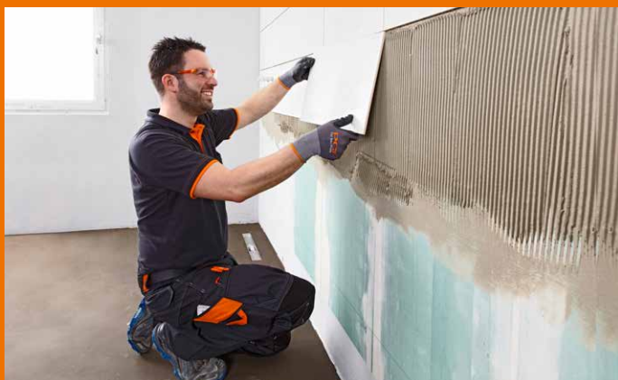
Entspannt und kraftsparend verlegen.